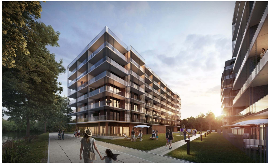
WIZUALIZACJA OBIEKTU | OBJECT VISUALISATION